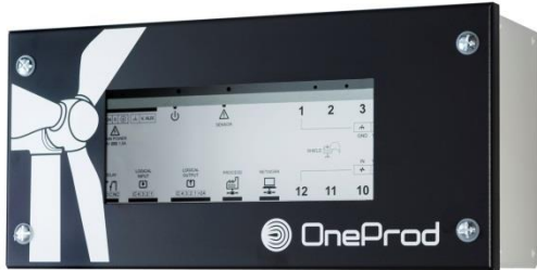
KITE Sistema de monitoreo para turbinas eólicas con su documentación y certificados